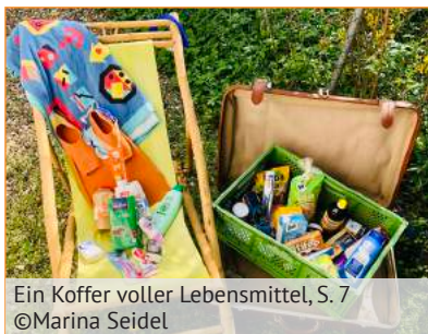
Ein Koffer voller Lebensmittel, S. 7