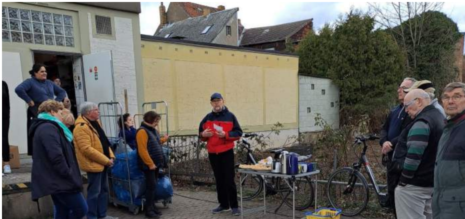
Kleidersammlung im März 2023

Freitag, 15.09. Kleidersammlung auf dem Parkplatz hinter dem Sozialen Kaufhaus am Brickelweg