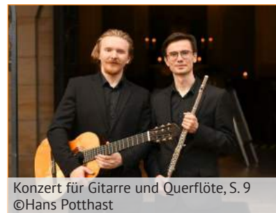
Konzert für Gitarre und Querflöte, S. 9 ©Hans Potthast