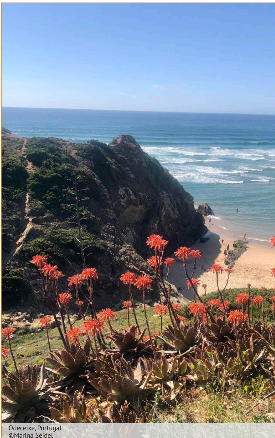
Odeceixe, Portugal

Herzlichst Marina Seidel für das Redaktionsteam