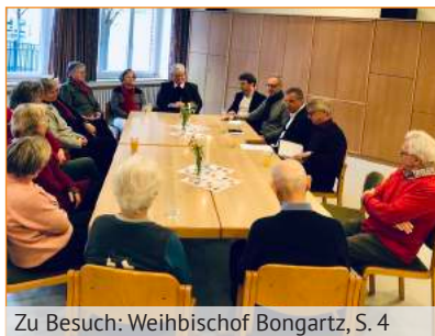
Zu Besuch: Weihbischof Bongartz, S. 4